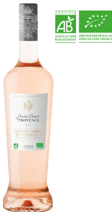
SAINT LOUIS DE PROVENCE