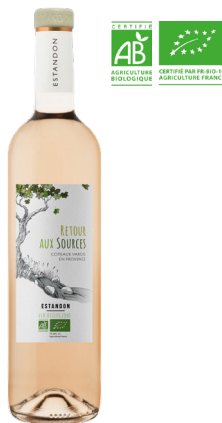
RETOUR AUX SOURCES