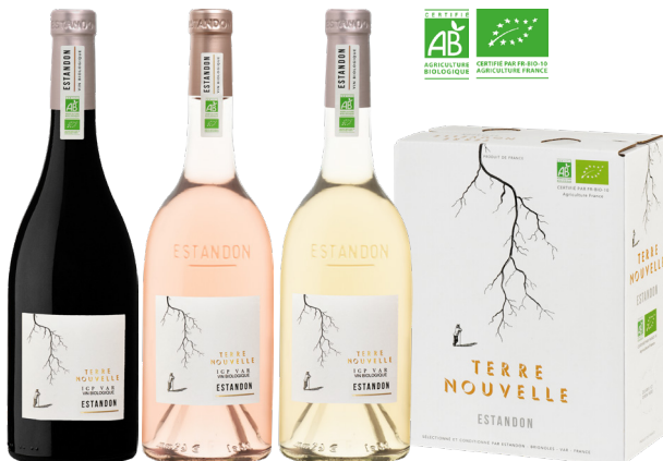
ESTANDON TERRE NOUVELLE