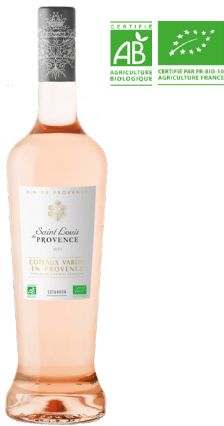
SAINT LOUIS DE PROVENCE