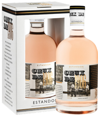
ESTANDON CEUX DE 1906