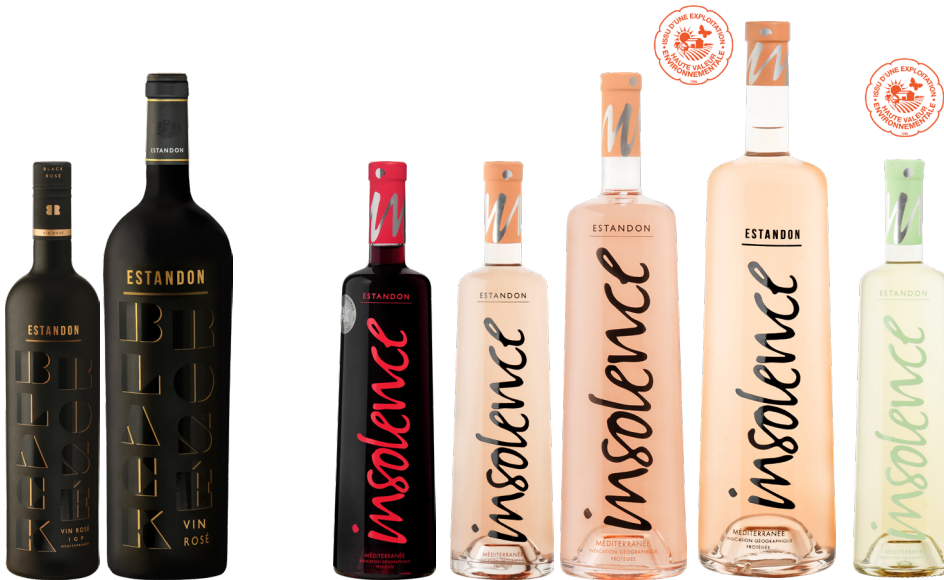
ESTANDON BLACK ROSÉ