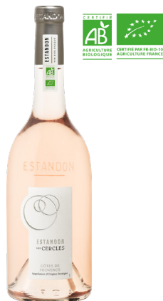
ESTANDON LES CERCLES