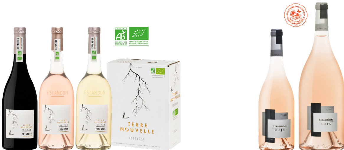
ESTANDON TERRE NOUVELLE