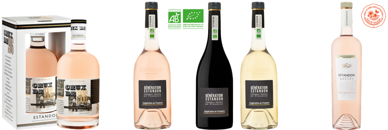
ESTANDON CEUX DE 1906