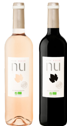
LE VIN NU