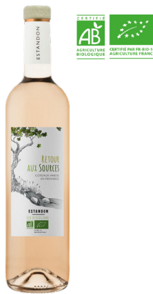
RETOUR AUX SOURCES