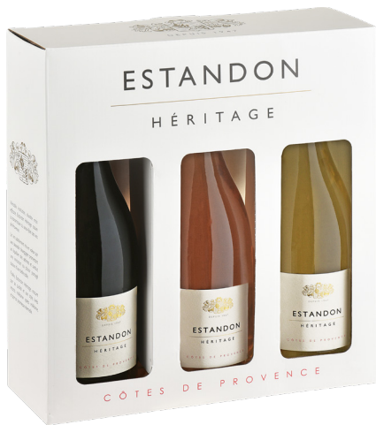
COFFRET ESTANDON HÉRITAGE