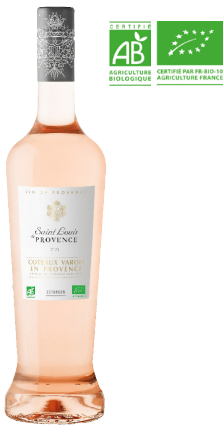
SAINT LOUIS DE PROVENCE