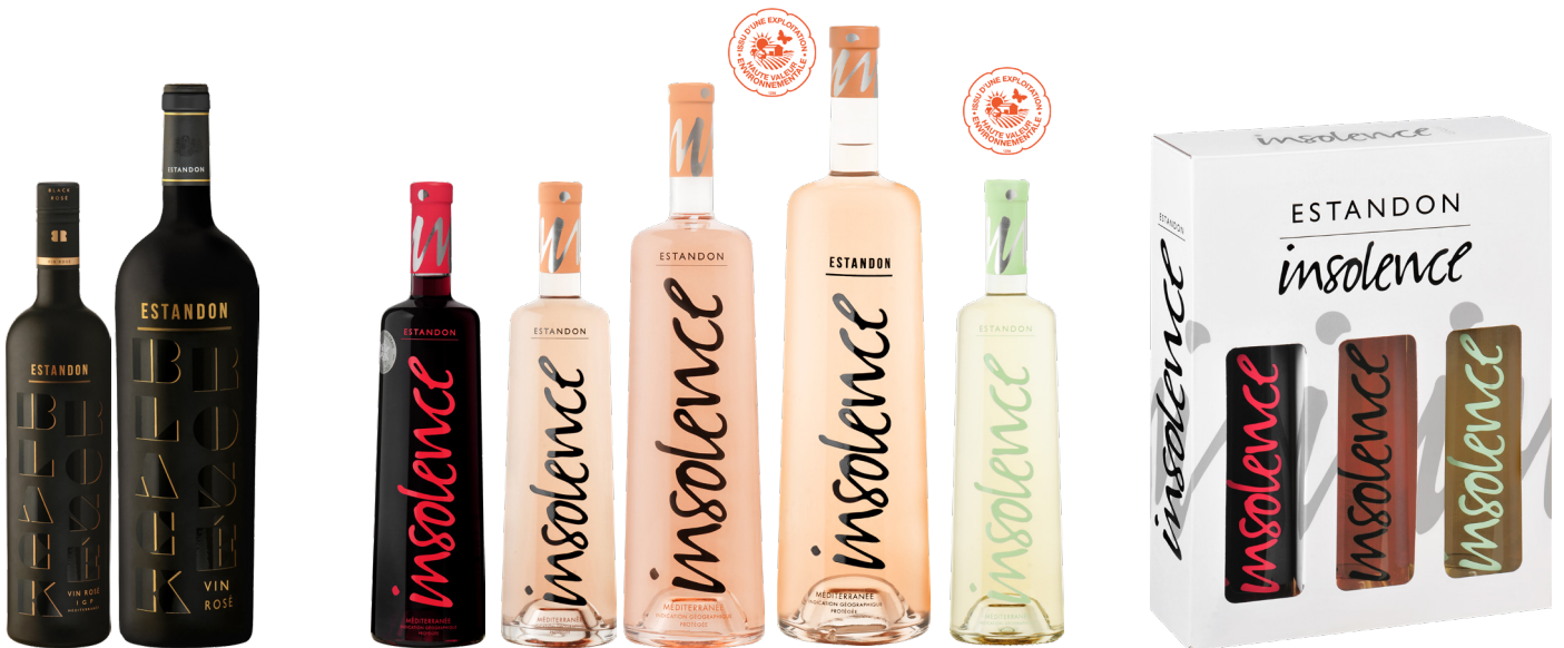
ESTANDON BLACK ROSÉ