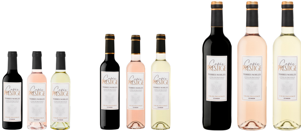
TERRES NOBLES «Cuvée Prestige»