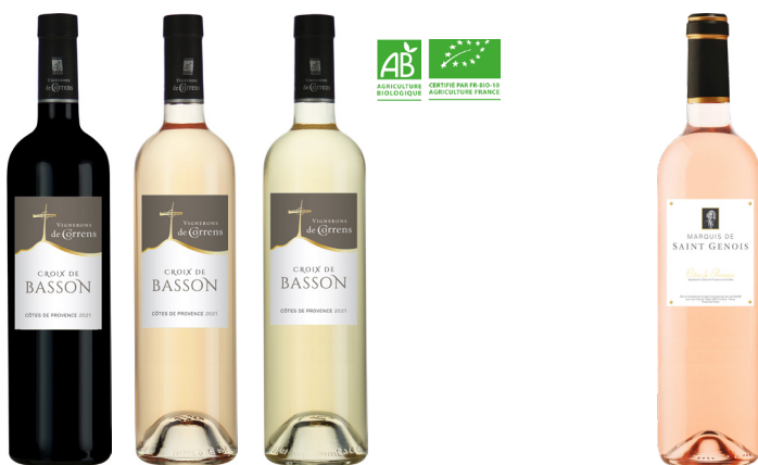
CROIX DE BASSON