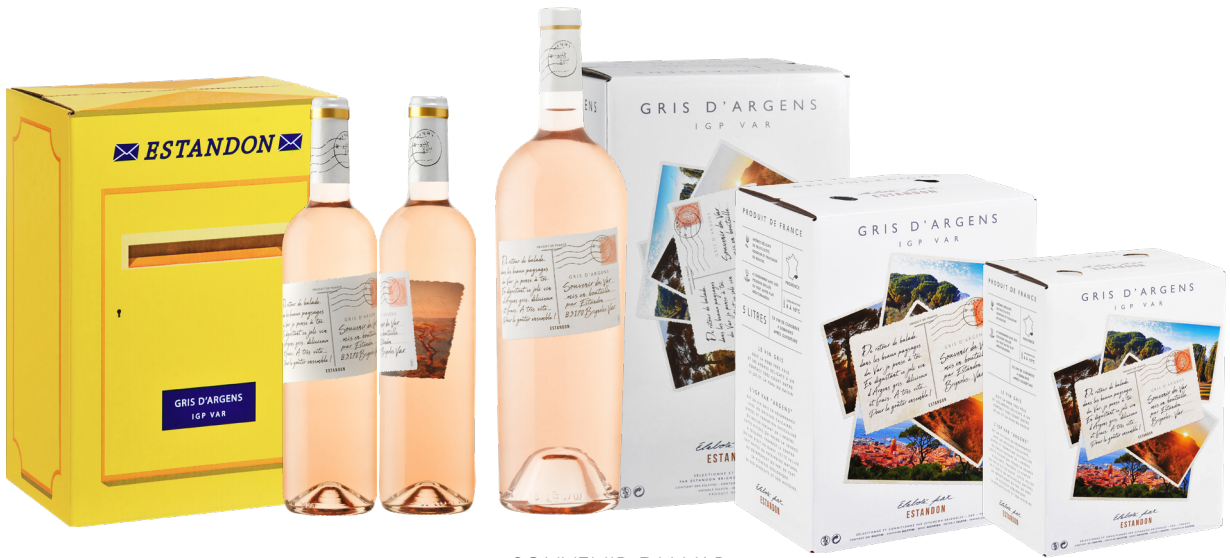
SOUVENIR DU VAR