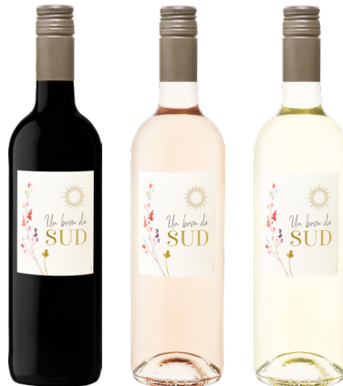
BRIN DE SUD