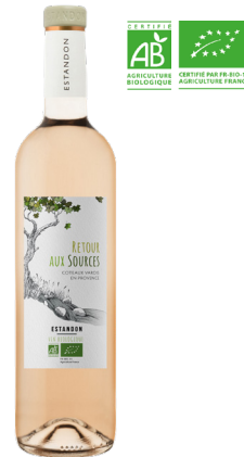
RETOUR AUX SOURCES