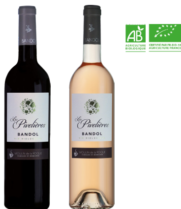
LES PIVELIERES BANDOL