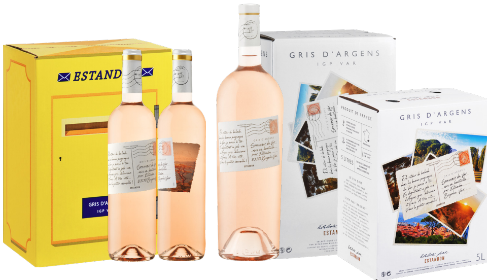
SOUVENIR DU VAR