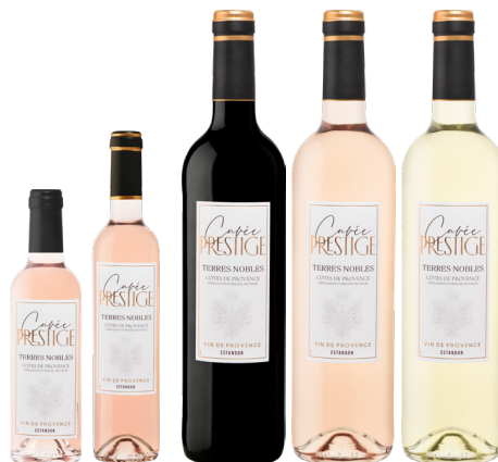
TERRES NOBLES «Cuvée Prestige»