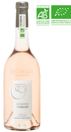
ESTANDON LES CERCLES