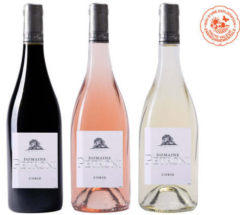
DOMAINE PETRONI CORSE