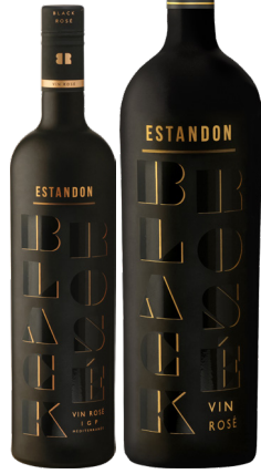
ESTANDON BLACK ROSÉ